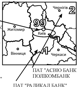
Рис. 4. Центральний макрорегіон з центром у Києві

НБУ щоденно працює над покращенням роботи банківської системи. Так, одним із кроків є прийняття рішення про поетапне підвищення рівня капіталізації банків та відповідно посилення їх стійкості до негативних змін на ринку та захисту інтересів вкладників і кредиторів внаслідок проведення стрес-тестування найбільших банків України. Діагностику проведено на базі балансів банків з аналізом кредитного портфеля банків, оцінкою вартості активів, а також переоцінкою застави [7].