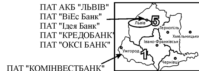
Рис. 1. Західний макрорегіон з центром у Львові

підвищення рівня капіталізації банківської системи; посилення захисту прав кредиторів та вирішення проблеми неякісних активів банків; зниження ризиків і підвищення довіри до банківської системи; підвищення стандартів діяльності та корпоративного управління банків на основі кращого світового досвіду; захист прав споживачів фінансових послуг і підвищення фінансової грамотності населення. Відповідно до джерела [5] проаналізовано, з якими юридично самостійними банками будуть працювати структурні одиниці НБУ за макрорегіонами. Так, західний і південний макрорегіони представлені 6 юридично самостійними банками (рис. 1, рис. 2).