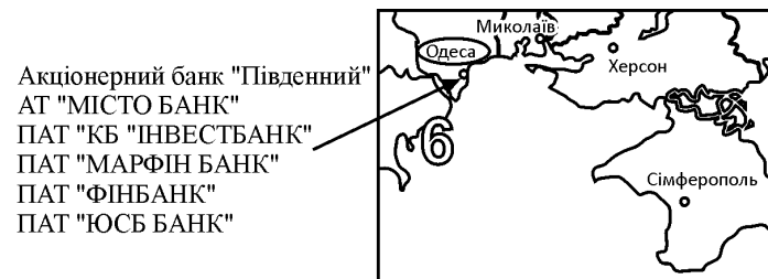
Рис. 2. Південний макрорегіон з центром в Одесі

Східний макрорегіон з центром у Дніпропетровську представлено 26 юридично самостійними банками (рис. 3).