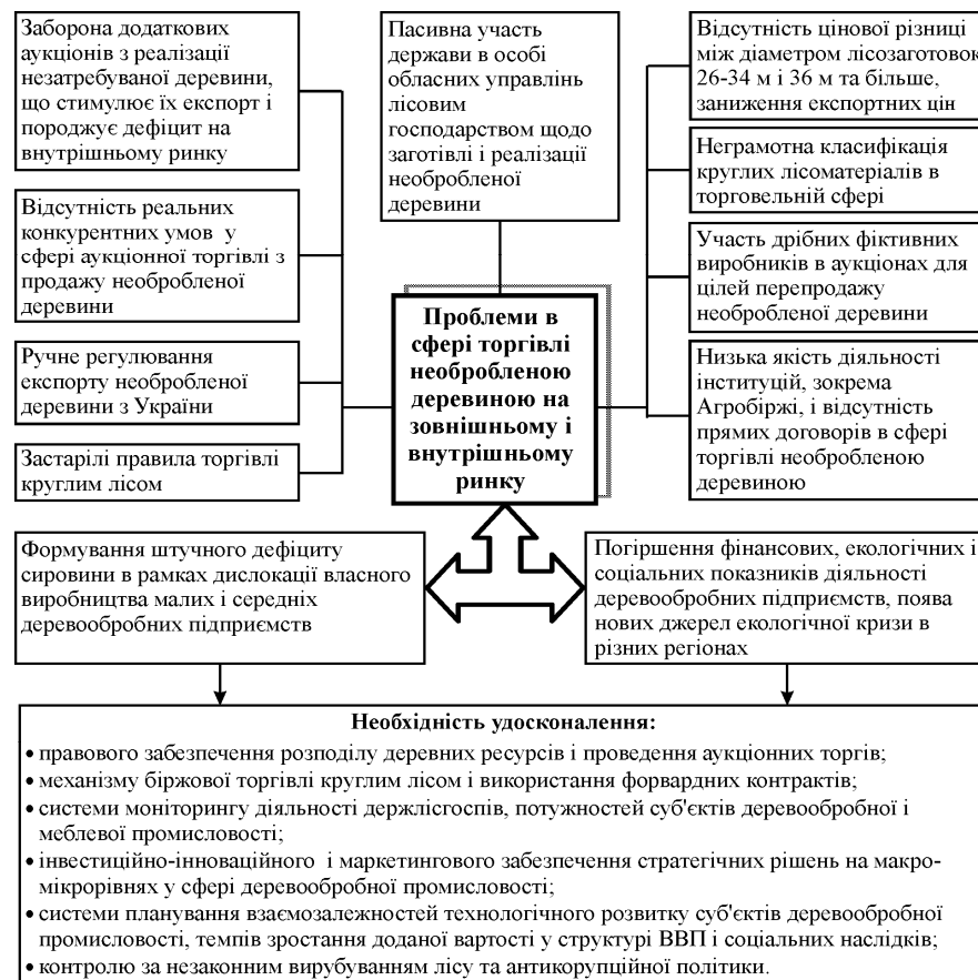
Рис. 3. Проблеми у сфері торгівлі необробленою деревиною на зовнішньому і внутрішньому ринках і напрямки удосконалення діяльності у сфері деревообробної промисловості