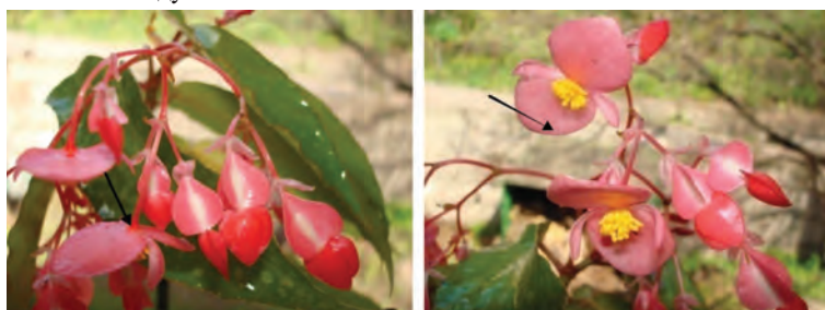
Рис. 2. Маточкові (А) та тичинкові (Б) квітки B. corallina

одиночку площі (рис. 3). Тому одним із напрямків наших досліджень було з'ясування зв'язку між наявністю кластерів прорихів та екологічною спеціалізацією того чи іншого виду бегоній.