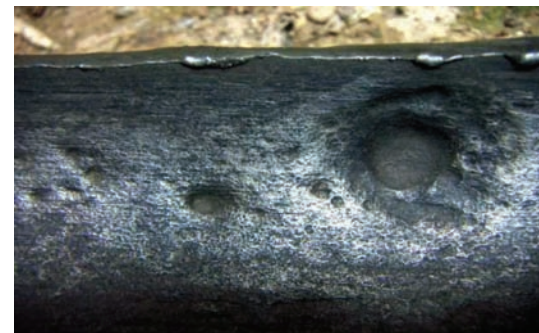
Рис. 2. Біокорозійні пошкодження внутрішньої поверхні трубопроводу діаметром 89 мм [4]

Ґрунтові мікроорганізми можуть зумовлювати корозію металу шляхом безпосереднього впливу на кінетику електродних реакцій, продукування речовин у процесі метаболізму, які спричиняють корозію, а також створення на поверхні металу умов для появи концентраційних електрохімічних елементів. У процесі біокорозії під дією ґрунтових мікроорганізмів пошкоджується як зовнішня, так і внутрішня поверхні трубопроводу з утворенням наскрізних руйнувань (рис. 2).