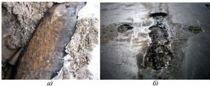
Рис. 1. Корозійні пошкодження підземних трубопроводів

Аналіз стану наявних досліджень та публікацій. Одним із стратегічних напрямів забезпечення енергетичної та екологічної безпеки нашої держави є проблема підвищення ефективності протикорозійного захисту підземних трубопроводів. На сьогодні в Україні експлуатується значна кількість магістральних трубопроводів, термін служби яких перевищує 30 років, що потребує значного збільшення витрат матеріальних і фінансових ресурсів на їх експлуатацію та підтримку проектних параметрів функціонування. Пошкодження металу підземних трубопроводів переважно мають корозійно-механічну природу (рис. 1; а, б). Це великі корозійні пошкодження (див. рис. 1, а), які виникають у місцях порушення ізоляції і зумовлені корозійною активністю ґрунтів та локальні корозійно-механічні пошкодження у вигляді поверхневих каверн (див. рис. 1, б), що виникають у разі пошкодження металу труби дією блукаючих струмів. Наявні також тріщиноподібні дефекти в матеріалі труби, що виникають внаслідок експлуатаційних навантажень.