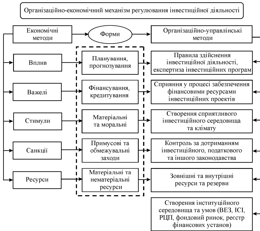
Рис. 1. Інструментарій реалізації організаційно-економічного механізму регулювання інвестиційної діяльності (авторська розробка)

кретизації форм впливу під час реалізації організаційно-економічного механізму регулювання інвестиційної діяльності.