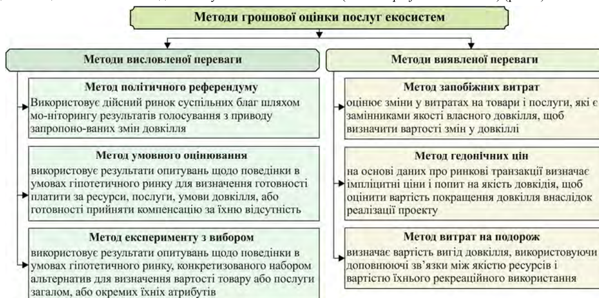
Рис. 1. Найпоширеніші методи визначення вартості послуг екосистем. Узагальнили автори за результатами опрацювання літературних джерел: Adamowicz et al. (1998), Bateman et al. (2002), Maselko (2002), Zahvoyska et al. (2006), Degtyar (2012)

Виклад основного матеріалу дослідження. Починаючи з 60-х років ХХ ст., економісти розробили цілу низку софістичних методів визначення вартості послуг екосистем, в яких використовують криву попиту (Hanley et al., 2001; Haines-Young & Potschin, 2009; Zahvoyska et al., 2006). Ці методи поділяють на методи висловленої ( stated preference methods ) та виявленої переваги ( revealed preference methods ) (рис. 1).