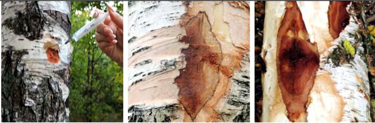
Рис. 1. Штучне зараження суспензією бактерій стовбурів берези повислої (зліва); прояв патології через 6 місяців (у центрі) та через 1,5 року (справа). Помітне істотне збільшення (справа) осередку ураження