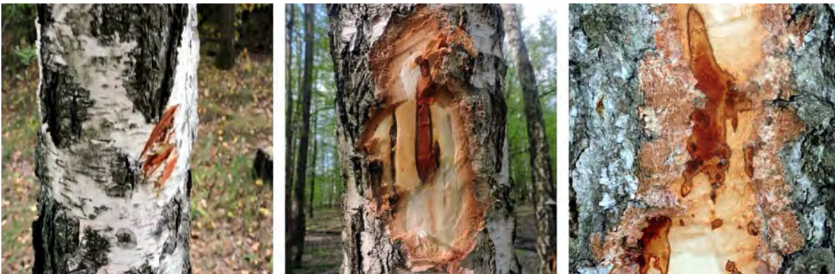
Рис. 2. Штучне зараження V. pendergastii культуральною масою стовбурів берези повислої (зліва); прояв патології через 6 місяців (у центрі) та через 1,5 року (справа)

Результати штучного зараження оцінювали за 5-бальною шкалою (Stanevich, Yuzhik & Yarmolovich, 2006; Wang, 2010). Виявлені певні відмінності в інтенсивності розвитку штучної бактеріальної патології (бал ураження, інфекційний клас) можуть бути пов'язані з індивідуальною стійкістю, а можливо, із різновидами дослідних рослин.