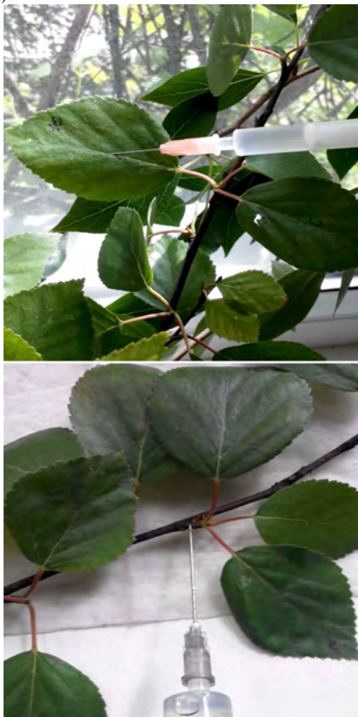
Рис. 3. Штучне зараження листків (зліва) і пагонів (справа), за якого не виявлено видимої бактеріальної патології

тивні – 8-15 мм, слабоактивні – 3-7 мм (Hvozdiak et al., 2011b).