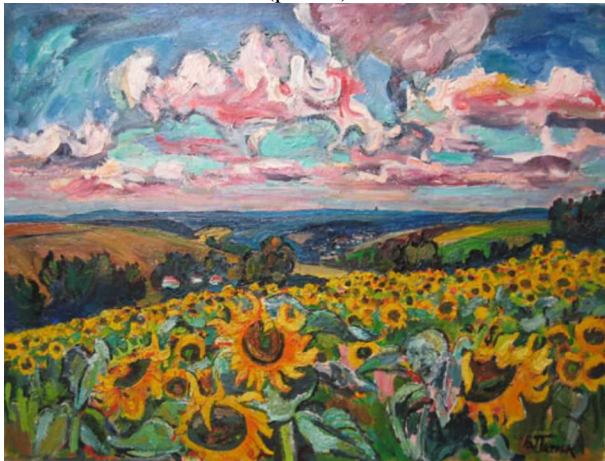
Рис. 2. Картина "Земля Шевченка". 1981. 90×120, п., о.

Кожна картина "шевченкіани", яку створив В. Патик, передає всю імпульсивність Володимира Йосиповича, його жагу до життя та любов до рідного краю. Кожне полотно дає нам змогу відчувати те, що відчував митець під час його написання. Для прикладу, звернемося до полотна "Земля Шевченка – однієї з робіт програмного малярського циклу, створеного упродовж 80-90-х років і відзначеного у 1999 р. Національною премією ім. Т. Г. Шевченка (рис. 2).