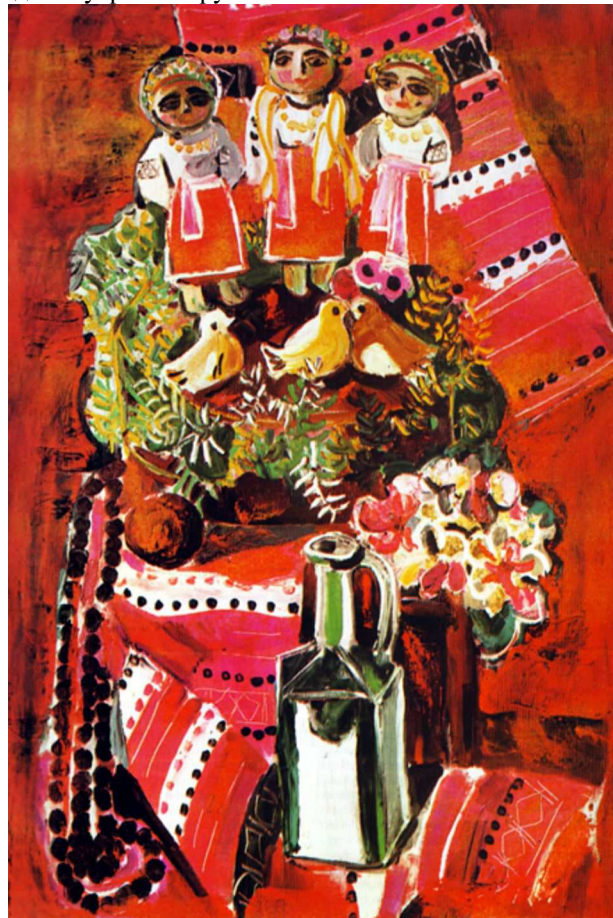
Рис. 1. Картина "Весільний коровай". 1966 р. 92×59, п., о.

Однією з найвідоміших робіт, яка засвідчила зрілість творчого почерку художника, є натюрморт "Весільний коровай", що зберігається сьогодні в експозиції Національного музею у Львові (рис. 1). У картині, як і в багатьох інших роботах цього періоду, художник використовує художню стилістику, близьку народному обрядовому фольклору.