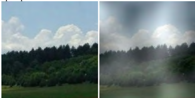
Рис. 5. Приклад накладання згенерованого шуму Перліна на зображення із прозорістю 50 %

Функція генерації шуму Перліна повинна приймати один числовий параметр і для одного і того ж вхідного параметра завжди повертати одне і те ж число. Це обов'язкова умова для цієї функції. Шум Перліна є результатом функцією – сумою значень заданої функції генерації шуму для різних амплітуд і частот (Cattin, Ph., 2016). При цьому кожен етап називається октавою і в процесі зазвичай рухаються від октави з великою амплітудою і малою частотою до октави з меншою амплітудою та більшою частотою. На кожній наступній октаві частота збільшується вдвічі. Кількість октав не є строго регламентованою і можна визначати, як часто, при якій кількість пікселів екрану дає змогу показати всі обчислені значення функції, так і найменшою амплітудою, при якій вплив октави на результуючу функцію неістотний. На рис. 5 зображено приклад накладання згенерованого шуму Перліна на зображення із прозорістю 50 %