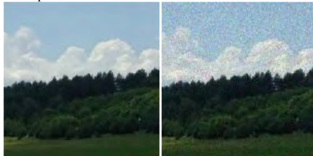
Рис. 2. Приклад накладання на зображення шуму Пуассона

Вважають, що в процесі випромінювання світла лазером фотони випромінюються випадково, але кількість фотонів, необхідна для утворення плями на стіні, така велика, що яскравість плями, тобто число фотонів за одиницю часу, змінюється з часом на дуже малу величину. Проте за умов незначної яскравості лазера кількість фотонів, що потрапляють на освітлювальну поверхню, буде достатньо малою, щоб відносні флуктуації числа фотонів, а з ними і флуктуації яскравості плями були значними. Ці флуктуації і є дробовим шумом. На рис. 2 зображено приклад накладання шуму Пуассона на зображення.