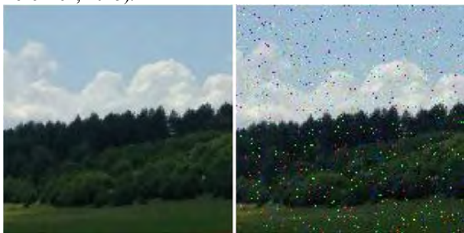
Рис. 3. Приклад накладання на зображення шуму типу "сіть і перець"

Якщо P_a або P_b = 0 , то такий шум називають уніполлярним. Якщо ж обидві ці ймовірності ненульові, то на зображенні будуть випадковим чином розташовані чорні та світлі точки (Gonzalez & Woods, 2002, р. 225). Імпульсний шум можна усунути шляхом віднімання темного фрейму та інтерполяції для обчислення значень пошкоджених пікселів (Sreeja & Budumuru, 2013). На рис. 3 зображено приклад накладання на зображення шуму типу "сіть і перець". Часто імпульсний шум накладається з Гаусівським шумом (Kucherov, Katsalarp & Zbrozhek, 2015).