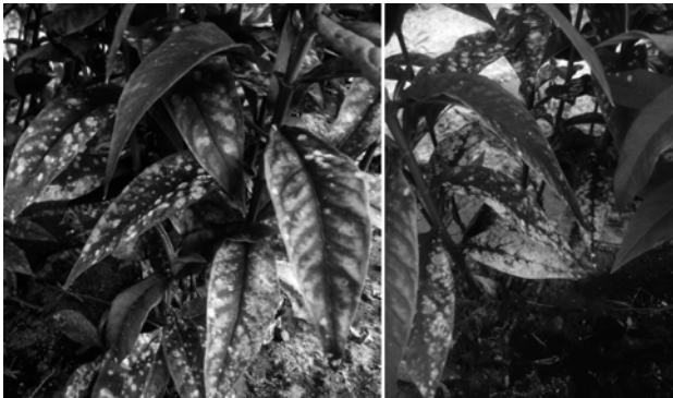
Рис. 1. Ураження збудником борошнистої роси рослин Phlox paniculata на колекційній ділянці

Окрім цього, на сучасному етапі головне завдання квітникарів та селекціонерів полягає у підвищенні стійкості рослин до зараження, яка може підвищуватись внаслідок перенесеного захворювання, так і внаслідок вакцинації (ослабленими культурами грибів, хімічними препаратами–імунізаторами), та сучасними методами клітинної біології. Замочування або обприскування насіння препаратами–імунізаторами (стимулятори росту, феноли, макро– та мікроелементи) здійснюють системну дію, змінюють метаболізм рослини–господаря, підвищують його стійкість, не здійснюючи впливу на патоген.