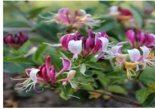
Рис. 2. Цвітіння жимолості каприфоль в умовах біостанціону ВНАУ

Першою зі стану спокою виходить жимолость каприфоль, пізніше – жимолость звичайна. У жимолості каприфоль терміни завершення вегетації майже збігаються із термінами місцевих порід, або дещо виходять за межі вегетаційного періоду, внаслідок чого в деякі зими кінці їх однорічних пагонів пошкоджувались. Незважаючи на це, рослини цвіли і плодоносили. Середня тривалість вегетації досліджуваних видів становить близько 227 днів (рис. 2).