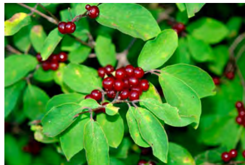
Рис. 3. Плодоношення жимолості звичайної (біостанціону ВНАУ)