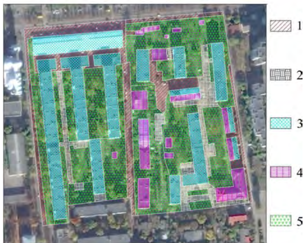
Рис. 1. Результати дослідження типів покриття житлового кварталу по вул. Широкий у м. Львові: 1, 2) відповідно напряму приєднані та неприєднані вдосконалені покриття доріг; 3, 4) відповідно напряму приєднані та неприєднані дахи будівель; 5) ґрунтові покриття та зелені насадження

Відповідно до нормативних значень загального коефіцієнта стоку для різних типів покриття (Pravyla korystuvannia, 2008), для кварталу по вул. Широкий отримано середньозважені за площею значення загального коефіцієнта стоку за трьома описаними вище методами. За методами № 1 і 2 отримано значення \psi_0=0,494 та \psi_0=0,496 , відповідно. З урахуванням ефективних водонепроникних покриттів за методом № 3 значення загального коефіцієнта стоку становить \psi_0=0,427 , що в 1,16 раза менше, ніж за методом № 2. Оскільки об'єм дощового стоку прямо пропорційний до значення загального коефіцієнта стоку, врахування особливостей приєднання водонепроникних покриттів до водовідвід-