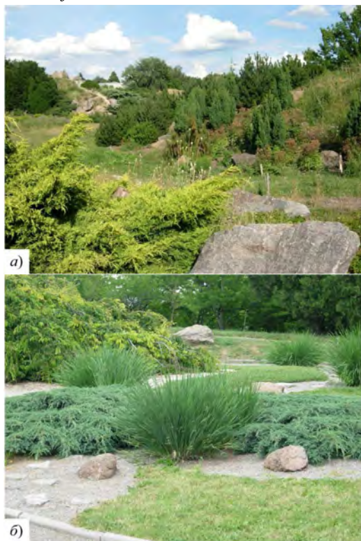
Рис. 1. Представники роду Juniperus L. в кам'янистих композиціях НБС ім. М. М. Гришка НАН України: а) "Австрійський альпійський сад"; б) "Гравійний сад"

до садів із мінімальним доглядом. Тут використано декілька видів гравійної відсіпки різного кольору і невибагливі до родючості ґрунту рослини переважно із зеленим та сизим забарвленням хвої: Picea abies 'Nidiformis', Juniperus squamata 'Blue Carpet', Picea pungens 'Glaucosa Globosa', Thuja occidentalis 'Woodwardii'.