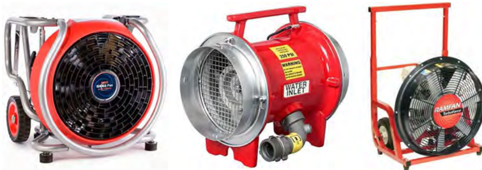
Рис. 3. Зовнішній вигляд сучасних зразків засобів димо- та тепловидалення, які є в розпорядженні пожежно-рятувальних підрозділів провідних країн світу