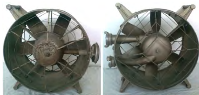
Рис. 2. Зовнішній вигляд сучасних зразків засобів димо- та тепловидалення, часів Радянського Союзу

Враховуючи наведене вище та той факт, що в пожежно-рятувальних підрозділах ДСНС України практично не застосовують пожежні димососи, актуальним є питання забезпечення ефективного гасіння пожеж пожежно-рятувальними підрозділами ДСНС України в умовах високої температури та задимленості із застосуванням зазначених засобів.