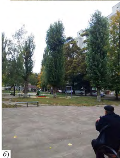
Рис. 1. Стан дерев Populus pyramidalis , що на вул. Бориса Тена: а) проведення глибокої омолоджувальної обрізки – березень 2016 р.; б) стан дерев через 2 роки – вересень 2018 р.