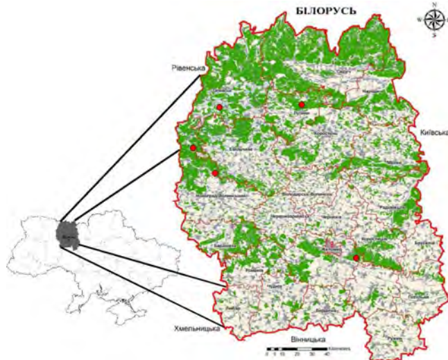
Рис. 1. Розташування об'єктів досліджень (Житомирська область, Україна)

Об'єкти і методи дослідження. Упродовж жовтня-грудня 2017 р. досліджено санітарного стану соснових деревостанів в осередках ураження короїдом верхівковим після проведення санітарних рубок вибірових, а також окремо – у кулісах і дрібноконтурних ділянках. Дослідження проведено у ДП "Новоград-Волинське дослідне лісомисливське господарство", ДП "Житомирське лісове господарство", ДП "Білокоровицьке лісове господарство", ДП "Лугинське лісове господарство", ДП "Городницьке лісове господарство" Житомирського обласного управління лісового і мисливського господарства (рис. 1).