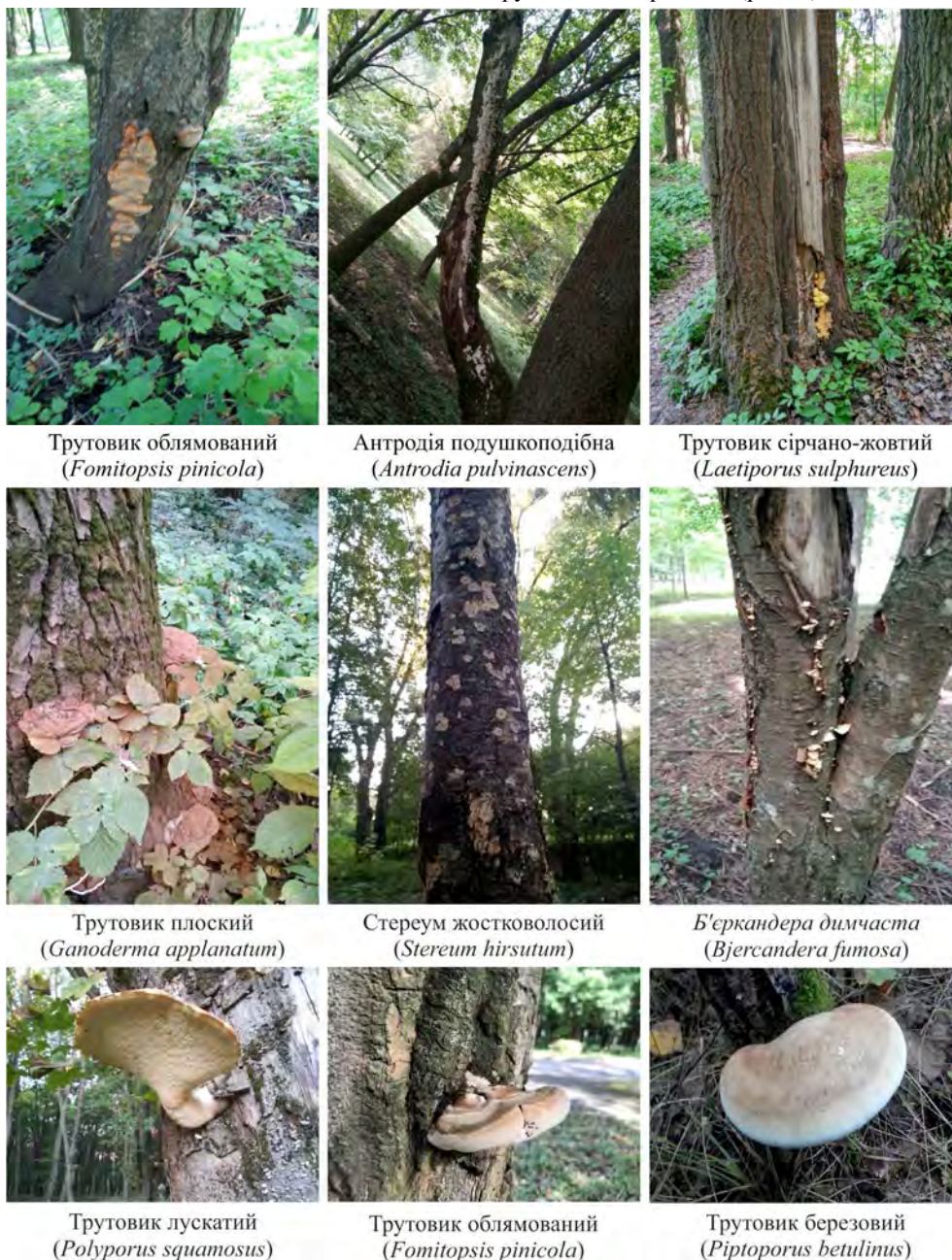
Рис. 2. Види дереворуйнівних грибів, поширених на деревних породах у Парку культури і відпочинку ім. Михайла Чекмана

Згідно з нашими дослідженнями, у Парку культури і відпочинку ім. Михайла Чекмана виявлено 29 видів дереворуйнівних грибів, які поширені на 14 видах деревних порід. Дереворуйнівні гриби зростають тут на коренях, стовбурах, гілках дерев, сухої деревини, пнях і шматках відпаду деревини. Їх поширення залежить від ступеня рекреаційного навантаження, ступеня механічного пошкодження певних порід дерев та стадії деструкції їхньої деревини. Найпоширенішими виявилися такі види дереворуйнівних грибів: трутовик облямований, б'єркандера обвуглена, б'єркандера димчаста, трутовик несправжній та стереум жорстковолосистий. Ці види дереворуйнівних грибів трапляються майже на всіх деревних видах парку, які пошкоджені дереворуйнівними грибами (рис. 2).