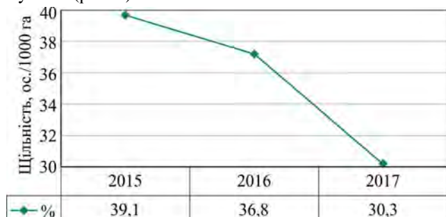
Рис. 1. Динаміка зміни частки витрат на охорону, відтворення, облік диких тварин та впорядкування мисливських угідь, %

Складовою частиною показника ефективності ведення мисливського господарства є витрати, що спрямовані саме на охорону, відтворення та облік диких тварин і впорядкування мисливських угідь. Проте, незважаючи на щорічне збільшення загальних витрат, саме їх частка у відсоткову співвідношенні, навпаки, зменшується (рис. 1).