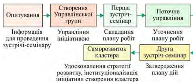
Рис. 2. Етапи створення локального рекреаційно-туристичного кластера в Кейлічі (Volkov, 2016)

На локальному рівні, де найвідчутніші соціально-економічні наслідки розвитку рекреаційно-туристичної сфери, ініціативи створення туристичних кластерів особливо важливі. Так, одна з найсильніших спільнот розвинулася в районі Кейліча (Khayelitsha), розташованого недалеко від Кейптауна. Цей район було вибрано як полігон для створення одного з чотирьох локальних РТК. Нерозвинена туристична сфера, конкуренція з боку інших туристичних районів країни, складна криміногенна ситуація – стартові умови для формування РТК в Кейлічі. Ініціювали його створення туристична адміністрація Капської провінції, яка на початках надала фінансову підтримку, і муніципалітет Тайге (Tyger). Робота відбувалася у кілька етапів (рис. 2). Одним із перших кроків було навчання в Кейлічі Управлінської групи з представників різних зацікавлених організацій. Під час проведених нею семінарів, консультацій, робочих зустрічей з широким колом учасників, починаючи з місцевих жителів і працівників туристичної індустрії до політичних діячів і міністра туризму ПАР, було вироблено план дій за трьома стратегічними напрямами – підготовка кадрів, маркетинг і забезпечення безпеки. Активну роль на цьому етапі взяли на себе члени міжнародного консорціуму ТСС, які надавали консалтингові послуги. Зазначимо, що ініціатива створення кластера походила знизу, всі зацікавлені сторони спільними зусиллями на місці виробляли стратегію розвитку за підтримки процесу прийняття рішень згори.