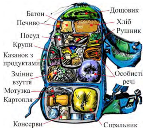
Рис. 2. Варіант укладання речей в наплічник

При укладанні наплічника досвідчені туристи дотримуються такого загального правила: важкі речі кладуть вниз або всередину і ближче до спини; м'які – до спини; об'ємні та крихкі – вгору; речі першої потреби – в кишені наплічника. Варто укласти речі в наплічник так, щоб при русі вони не гриміли між собою. Також важливо запам'ятати місце розташування різних речей в наплічнику, щоб за потреби деяку річ можна швидко дістати, а не порпатися в наплічнику (рис. 2).