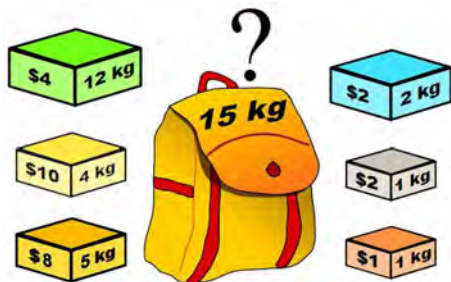
Рис. 1. Приклад задачі про ранець (Knapsack problem, 2019)

(Dantzig, 1957; Kellerer, Pferschy & Pisinger, 2004, p. 9), особливо в 1970-90-і роки як видатними теоретиками, так і знаними практиками (Martelo & Toth, 1990, p. 2). Задача про ранець є однією з 21 NP-повних задач Річарда Карпа (англ. Richard Karp ), викладених у його статті під назвою "Reducibility Among Combinatorial Problems" в 1972 році (Karp, 1972).