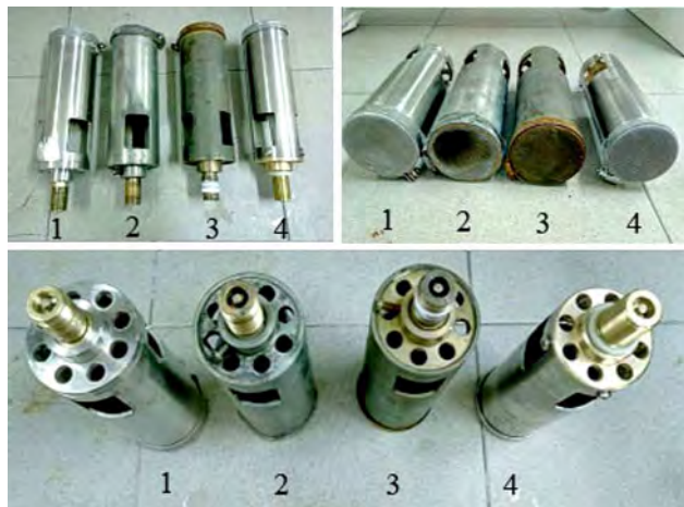
Рис. 1. Зовнішній вигляд лабораторних піногенераторів, що застосовували у ході досліджень: 1) піногенератор, наданий ДВЛ ГУ ДСНС України в Миколаївській області (№ 1); 2) піногенератор НДЦ "Пожежна безпека" (№ 2); 3, 4) піногенератори, надані ДВЛ ГУ ДСНС України в Одеській області (№ 3 та 4)

Зовнішній вигляд піногенераторів представлено на рис. 1.