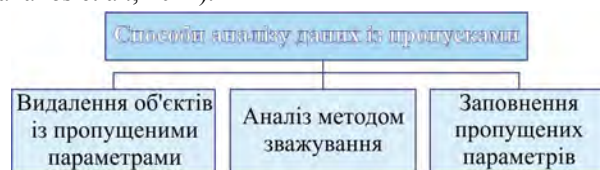
Рис. 1. Способи аналізу даних з пропусками

його використання є приналежність пропущених параметрів до MCAR. Окрім цього, цей метод не є ефективним, бо необхідно, щоб кількість пропусків була невеликою, інакше можуть виникнути сильні зміщення (Karahalios et al., 2012).