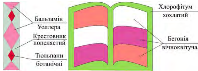
Табл. 4. Асортимент квіткових рослин, дерев та кущів (проектований)

Для оформлення квітника у формі книги (рис. 3) рекомендуємо використати такі квіткові рослини, як хлорофітум хохлатий ( Chlorophytum comosum ) та бегонію вічноквітучу ( Begonia semperflorens Link et Otto) різних кольорів.