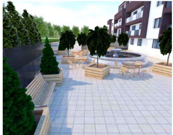
Рис. 4. Зона кафе з елементами озеленення та благоустрою / Café area with elements of landscaping and improvements

трального входу до готелю та будуть зручними у використанні для літніх людей та людей з обмеженими можливостями. Планом озеленення передбачено висаджування таких рослин (табл. 4).