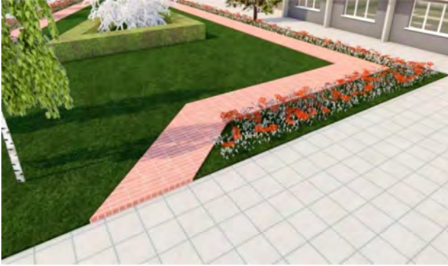
Рис. 3. Доріжка для прогулянок у зоні відпочинку / Walkway in the rest area

Зону справа від центрального входу (зона кафе) плануємо оновити за допомогою декоративних рослин у кашпо (рис. 4), в яких буде посаджено дві форми рослин пірамідальної та плакучої форм, для створення контрастності території.