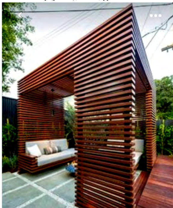
Рис. 2. Альтанка для зони відпочинку / Gazebo for rest area

Багато насаджень на території проєктованої ділянки було закладено без урахування правил стилістики. Оскільки рослини розташовані здебільшого хаотично, треба було приділити увагу гармонійному поєднанню їх зі стилістикою майбутнього озеленення. Реконструкція зелених насаджень та благоустрою території надасть об'єкту цікавого та комфортного вигляду. Із архітектурних елементів проєктуємо встановлення альтанки для зони відпочинку (рис. 2), лавок, урн для сміття.