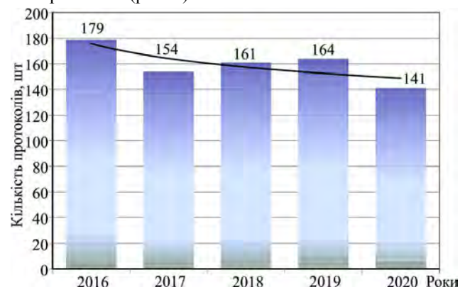
Рис. 1. Кількість складених протоколів за порушення правил полювання з 2016 по 2020 роки на території Хмельницької області, шт. / The number of reports for violations of hunting rules from 2016 to 2020 in Khmelnytskyi Region

За даними Хмельницького обласного управління лісового та мисливського господарства з 2016 по 2020 роки на території Хмельниччини було складено загалом 799 протоколи (рис. 1).