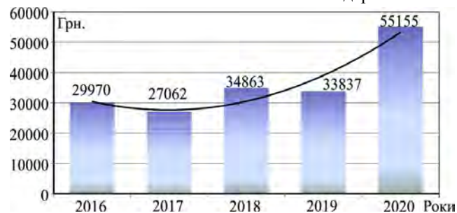
Рис. 3. Накладено штрафів на порушників правил полювання з 2016 по 2020 роки на території Хмельницької області, грн / Violators of hunting rules were fined from 2016 to 2020 in Khmelnytsky Region, hryvnia

торії державних підприємств Проскурівського та Славуцького лісових господарств. Встановлено, що кількість випадків браконьєрства залежить від наявності населених місць біля мисливських господарств, тому й найбільшу кількість порушень правил полювання фіксують на територіях Ярмолинецького, Старокостянтинівського та Шепетівського лісових господарств.