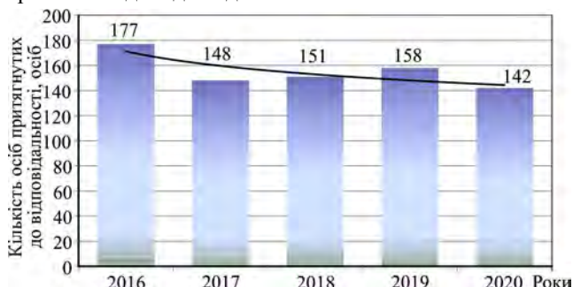
Рис. 2. Кількість осіб, що були притягнуті до відповідальності за порушення правил полювання з 2016 по 2020 роки на території Хмельницької області, осіб / Number of persons prosecuted for violating hunting rules from 2016 to 2020 on the territory of Khmelnytsky Region, persons

На рис. 2 показано кількість осіб, притягнутих до відповідальності за порушення правил полювання з 2016 по 2020 роки на території Хмельницької області. З наведених даних видно, що кількість осіб, притягнутих до відповідальності за порушення правил полювання, має також чітку тенденцію до зниження за останні 5 років, якщо у 2016 р. це було 177 осіб, то в 2020 р. було притягнуто до відповідальності тільки 142 особи.