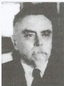
Рис.4 М.Д. Стражеско