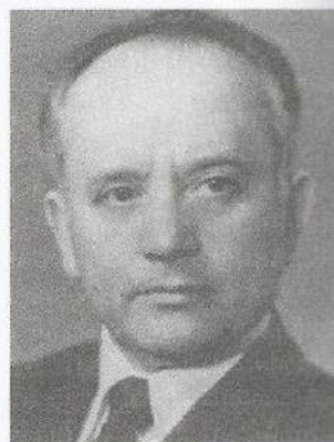
Рис.8 І.І. Бобрик

З 1978 р. професор Іван Іванович Бобрик очолив кафедру нормальної анатомії НМУ. Він вперше виявив реактивні та деструктивні зміни в нервових елементах не тільки оперованих органів, але і в інших відділах автономної нервової системи (реактивні зміни в синапсах черевного сплетення, деструкція рецепторів в ендокарді експериментальних тварин). На кафедрі анатомії під керівництвом професора І.І. Бобрика вивчалася мікроциркуляторне русло людини в пренатальному періоді онтогенезу. Результати наукових досліджень кафедри нормальної анатомії НМУ щодо вивчення морфогенезу мікроциркуляторного русла