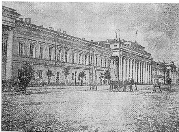
Казанський університет в 30-і роки XIX століття (з сучасної гравюри)