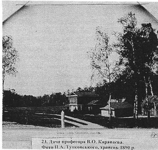
23. Дача професора В.О. Караваєва. Фото П.А. Тутковського, травень 1890 р.

Поховання В.О. Караваєва сталося 6 березня о 10 годині ранку в Києві на Байковому кладовищі у відповідність з усіма належними християнськими обрядами. Цього дня попрощатися з Караваєвим прийшла значна частина жителів стоїтидесятитисячного Києва. Прибули депутати з Москви і інших міст Росії. Свою скорботу виразили багато громадських організацій і духовенство. На похоронах була присутня у повному складі Рада університету на чолі з ректором Ф.Я. Фортинським, деканами усіх факультетів, професорами. Ніколи вулиця, де знаходилася квартира В.О. Караваєва, і площа перед університетом не були такими багатолюдними, як цього дня. Від Університету до Байкового кладовища труну з тілом В.О. Караваєва несли на руках. Поховано В.О. Караваєва було в I секторі кладовища, де у послідуєчому було встановлено пам'ятник з надписом: "Тут покоїться тіло Дійсного Таємного