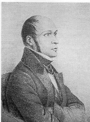
Микола Іванович Пирогов (1810-1881) в період роботи в Дніпрському університеті