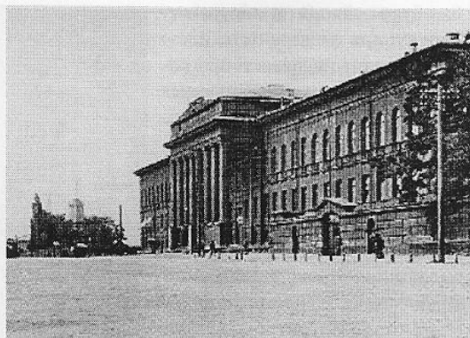
Університет Святого Володимира

1 грудня 1890 року в газеті "Київське слово" з'явилася повідомлення наступного змісту: "Київ збирається вшанувати 50-річний ювілей діяльності професора В.О. Караваєва належним чином". На засіданні думи міський голова, вказавши на величезні заслуги Караваєва і на його загальну популярність, запропонував послати в день 50-річного ювілею професорської діяльності В.О. Караваєва депутацію для принесення поздоровлення і піднесення хліба і солі.