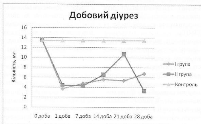
Рис. 1. Добовий діурез у експериментальних щурів, які зазнали впливу імпульсного модульованого (I група) та безперервного (II група) опромінення

Маса нирок у щурів II групи протягом всього періоду спостереження суттєво не відрізнялась від контрольних значень. В першу добу після опромінення 1,40 \pm 0,13 г, на 7 добу 1,60 \pm 0,10 г, на