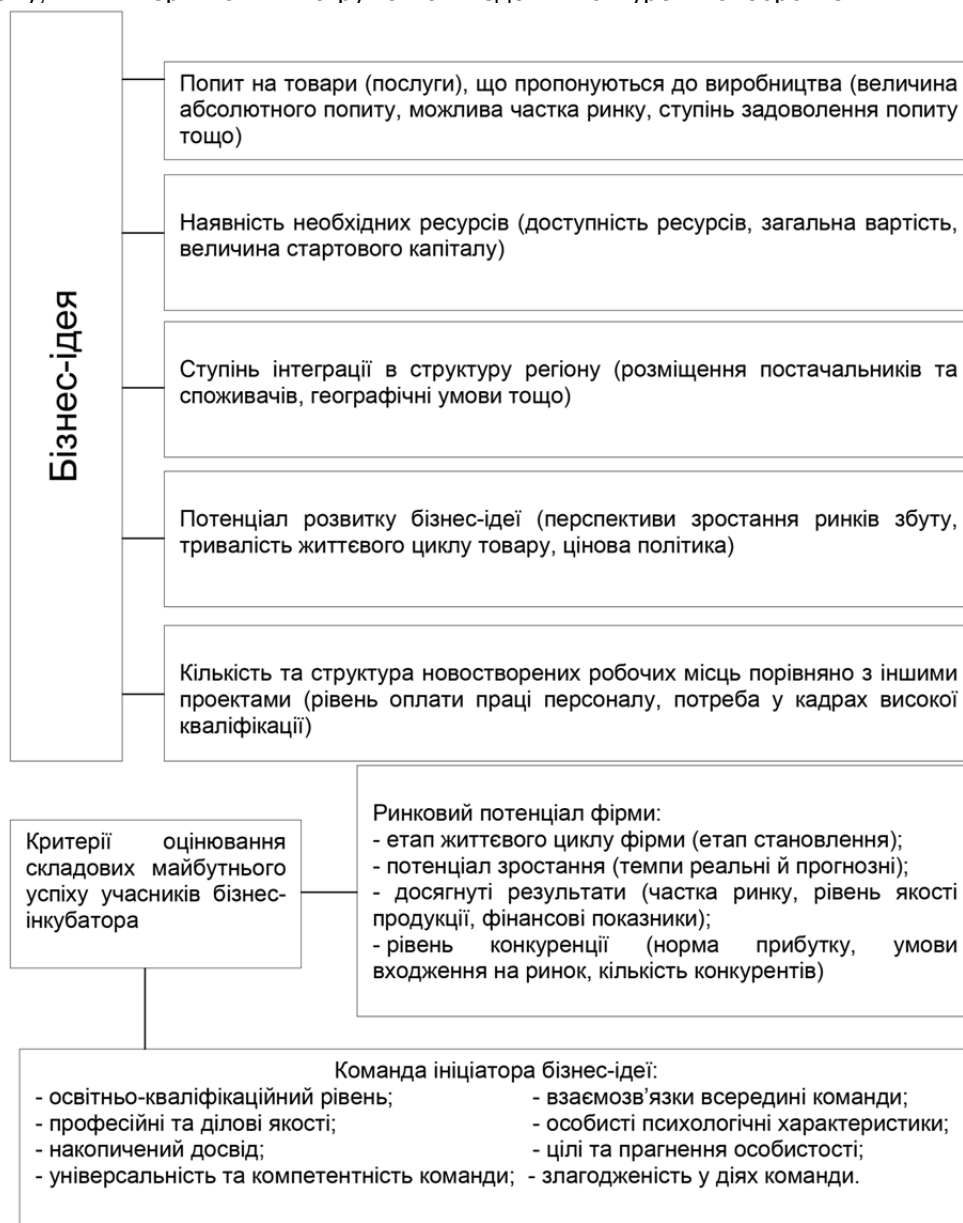
Рис. 4. Складові майбутнього успіху учасників бізнес-інкубатора та критерії їх оцінки

дять дещо інші, ніж у традиційних ринкових відносинах, чинники успіху бізнесу. За таких умов істотна роль відводиться зв'язкам, партнерству, родинним відносинам, лобіюванню інтересів, фаворитизму, іншим неринковим інструментам ведення конкурентної боротьби.