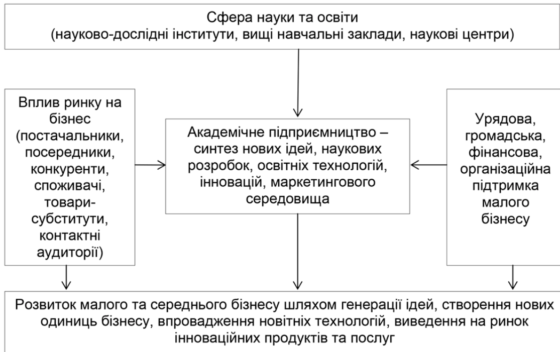
Рис. 3. Роль академічного бізнес-інкубатору у розвитку малого бізнесу