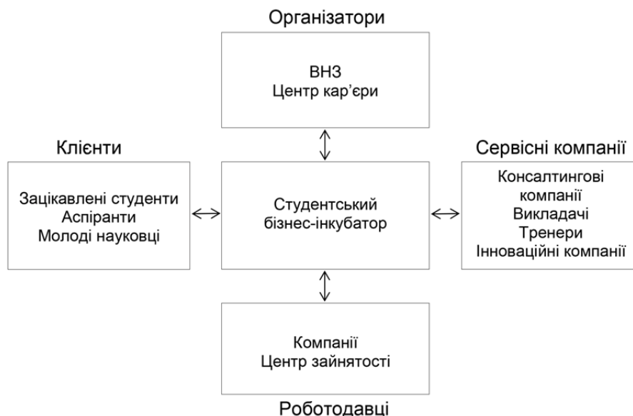
Рис. 2. Модель взаємодії зацікавлених учасників студентського бізнес-інкубатора

Зацікавленими сторонами проекту створення студентського інноваційного інкубатора є: студенти, які є носіями бізнес-ідей; підприємницькі об'єднання, бізнес-спілки; прогресивні компанії; суспільство; держава. В якості сервісних компаній можуть виступати: професорсько-викладацький склад ВНЗ, індивідуальні підприємці, що мають відповідну кваліфікацію та реєстраційні документи, венчурні фонди, представництва різних міжнародних організацій (рис. 2) [7].