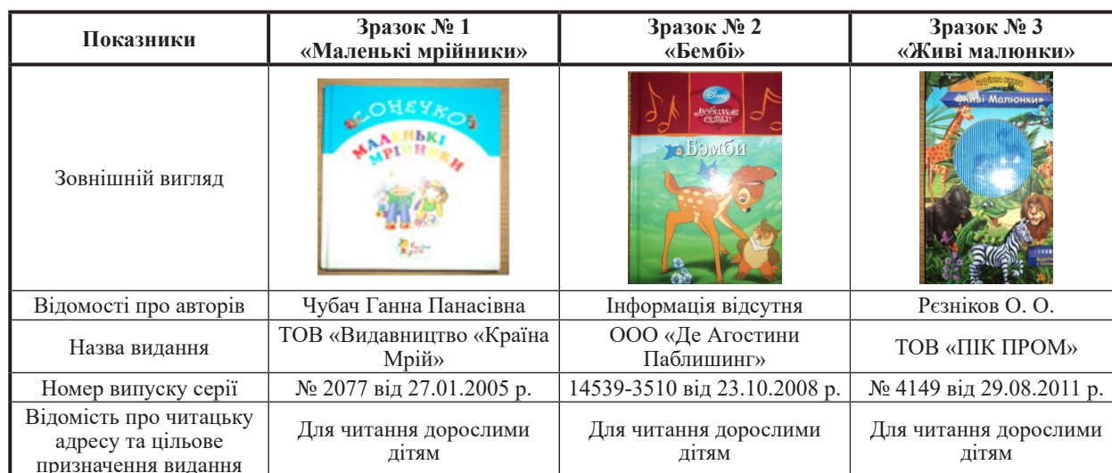
Характеристика об'єктів дослідження

У ході дослідження застосовано об'єктивні (вимірвальний, розрахунковий) й евристичні (органолептичний, експертний) методи оцінки якості друкованих видань. Методи визначення показників якості описано в законодавчому документі Державні санітарні норми і правила «Гігієнічні вимоги до друкованої продукції для дітей» [5].