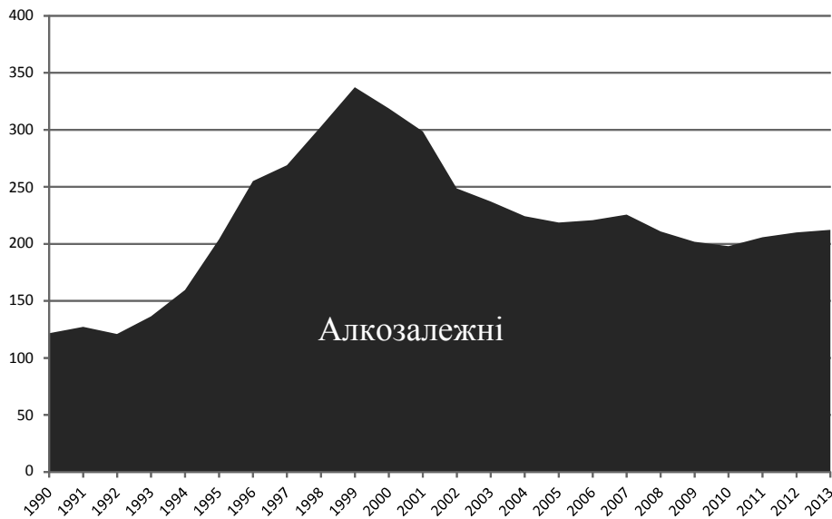
Рис 1. Динаміка епідемії залежності від алкоголю

кандидат медичних наук Л.Маркозова). Для усунення шуму застосовувався метод змінного середнього з одиничною апертурою.