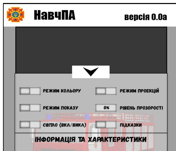
Рис.2. Розгорнуте меню налаштувань та інформації

Наведемо приклад розгорнутого меню з налаштуваннями та характеристиками, та наведемо опис базового функціоналу (рис.2).