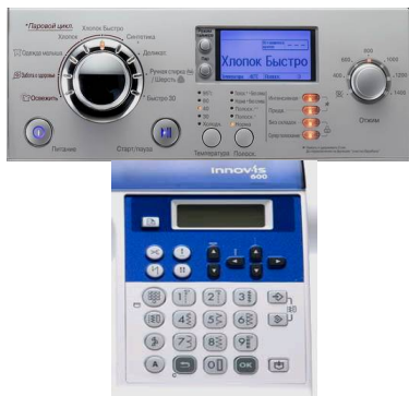
Рис. 1. Швейна машина з програмним електронним управлінням.

Перенесення знань і вмінь користування пристроєм вводу здійснюють на основі вивчення інструкцій органів керування більшістю засобів професійної діяльності учителів обслуговуючої праці. Так, на панелях органів керування переважної більшості сучасних побутових пристроїв, зокрема пральної машини-автомата і швейної машини (рис. 1.) є блок клавіш.