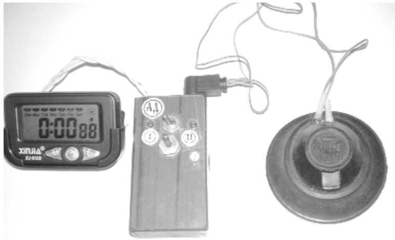
Рис. 1. Загальний вигляд експериментального модуля: секундомір, мікровимикач, акустичний датчик

Перше безпосереднє спілкування учнів з комплектом фотодатчика і секундоміра здійснюється в установці для визначення прискорення вільного падіння. Необхідність забезпечення належної точності вимірювань досить малих проміжків часу, де вагомими є соті долі секунди, уможливорюється за рахунок використання саме фотодатчика. Виконання такого завдання у пропонованому нами варіанті реалізуються у лабораторній роботі або як варіант експериментальної задачі (№ 4.155) [3, с. 115]. Такий підхід дозволяє зекономити час на постановку робіт практикуму, охопивши змістом однієї роботи завдання кількох робіт, наприклад робіт 3-8, 12-14, що передбачені навчальними програмами [6].