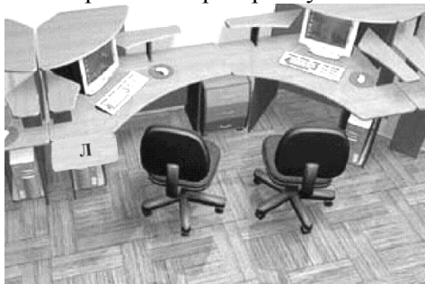
Рис. 1. Загальний вигляд робочого місця студента (варіант).

За ергономічними показниками (гігієнічними, антропометричними тощо) дисплеї комп'ютерів повинні бути повернутими до класу екранами, а зворотною стороною до стіни: за ними зона є забороненою для перебування оператора. Задоволення цих і визначених вище умов можливе за комплексного підходу до проектування і обладнання таких лабораторій. В оптимальному варіанті це розв'язується шляхом проектування і використання специфічних за розмірами і формою робочих столів. Так, відповідно до максимальної і оптимальної робочої зони рук оператора [3] кришки робочих столів мають форму, яка дозволяє розв'язати проблему робочих місць найкомпактнішим чином [2]. Звичайно такі столи розташовують вздовж стін (див. рис. 1). До віддалених і паралельних до стіни сторін приставляється лабораторний стіл Л, на якому розташовують елементи лабораторної установки, чи практичного завдання. Сидіння, яке може обертатись, дозволяє студенту, не встаючи, зміщувати моторну зону до комп'ютера чи лабораторної установки.