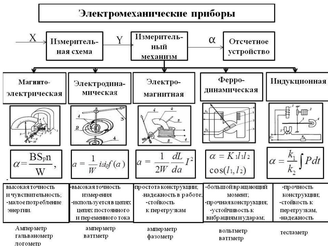
Рис. 1. Концептуальная диаграмма

Концептуальная диаграмма «Электромеханические приборы» построена в соответствии с планом изложения темы и позволяет выявить структурные связи предмета изучения. На ней представлена структурная схема электромеханического средства измерения, состоящая из основных блоков, преобразующих измерительный сигнал, основные системы измерительных механизмов, которые положены в основу классификации электромеханических приборов. На рисунках отображено устройство измерительных механизмов различных систем. Ниже приводятся уравнения преобразования или иначе – уравнения шкалы, которые связывают входную величину средства измерения – электрическую и выходную величину – механическую. Анализ уравнений преобразования позволяет определить, какие из приборов будут иметь линейную функцию преобразования, а также для измерения каких электрических величин могут использоваться электромеханические приборы различных систем. Далее приводятся основные достоинства приборов и области их применения. Использование концептуальной диаграммы позволяет обучающемуся систематизировать полученные знания по изучаемой теме.