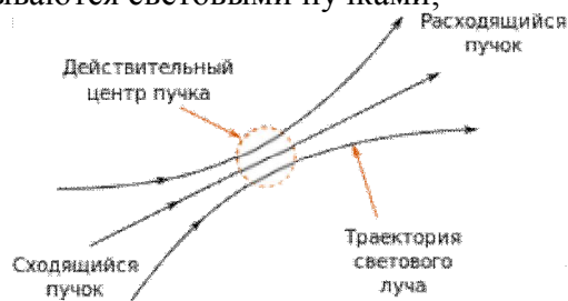
Рисунок 1. Свет, распространяющийся в прозрачной неоднородной среде, образует два пучка (сходящийся и расходящийся) с общим „размытым“ (не точечным) центром

• цилиндрические или канонические каналы, внутри которых распространяется свет, называются световыми пучками;