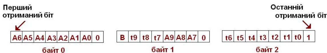
Рис. 2. Розміщення даних в трибайтних групах, характерних для роботи системи АЦП в режимах: D , E . Літерою A на рисунку позначають біти, що відповідають числу виміряному АЦП, а літерою t біти, що характеризують значення інтервалу часу, що зафіксований лічильником в момент виконання вимірювання. Цифри біля літер вказують на порядок даного біту у відповідному числі. Біт B рівний 0 якщо період вибірки АЦП менший за період рахунку лічильника часових інтервалів від 0 до максимального значення.

Автори статті готові співпрацювати з іншими науковцями з метою доповнення та усунення недоліків у протоколі “НП-01”.