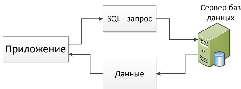
Рисунок 3 – Схема взаимодействия приложения с сервером баз данных

Структурно приложение представляет собой иерархию каталогов для хранения в них сопутствующей информации определяющей корректное функционирование системы (рисунок 2). В каталоге «SmuApp» хранятся контроллеры и модели передающие данные между собой для более удобной разработки логики приложения. Для отслеживания запросов пришедших от пользователей и ошибок, которые могут возникнуть в процессе вся соответствующая информация записывается в журнал событий, хранимый в каталоге «Log». Каталог «Public» предназначен для хранения файлов доступных для скачивания пользователю системы. Ключевым звеном в работе приложения является файл, хранящийся в каталоге «Script», к которому обращается веб сервер для установления связи между контроллерами, моделями, и представлениями (рисунок 3).