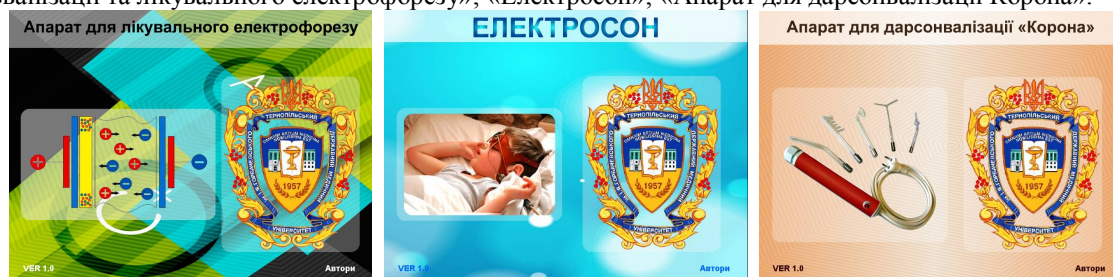
Рис. 1. Титульні сторінки віртуальних навчальних тренажерів

В даній статті розглядається три віртуальні навчальні тренажери (рис. 1): «Апарат для для гальванізації та лікувального електрофорезу»; «Електросон»; «Апарат для дарсонвалізації Корона».