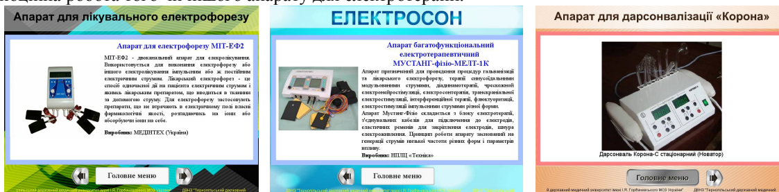
Рис. 2. Сучасні прилади для електротерапії

У пункті «Структурна схема» студент може визначити основні блоки приладу, без яких неможлива повноцінна робота того чи іншого апарату для електротерапії.