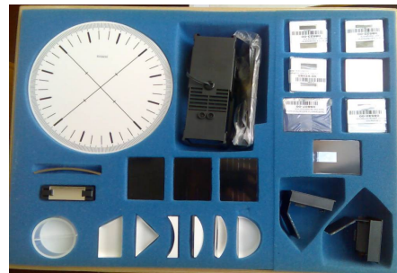
Рис. 2. Набір для виконання лабораторних робіт з геометричної та хвильової оптики

Набір з геометричної та хвильової оптики для виконання фронтальних лабораторних робіт є зручним в користуванні і компактним у зберіганні та використанні (додатки, А6, А7, А8) (рис. 2).