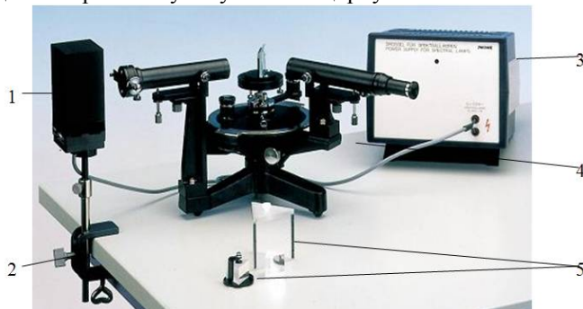
Рис. 3. Експериментальна установка: 1 – спектральна лампа, 2 – настільний затискач, 3 – джерело струму, 4 – спектрометр-гонометр з ноніусом, 5 – призми

4. Використайте ґратку з меншою кількістю освітлених щілин та визначте її роздільну здатність. Для цього розташуйте штангенциркуль, використаний як допоміжна ґратка, навпроти лінзи коліматора, щоб світло не доходило до щілини при зімкнутому штангенциркулі.