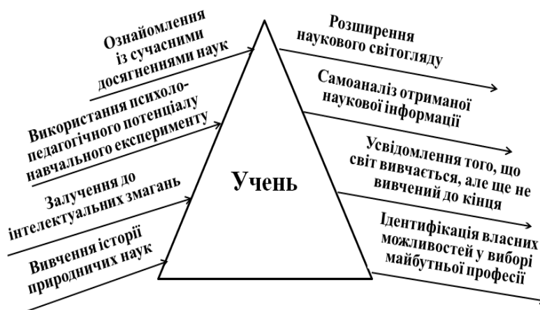
Рис. 1. Процес розвитку інтересу в учнів до природничих наук

Виклад основного матеріалу. Наука містить в собі широкий спектр загальнолюдських цінностей. Залучаючи учнів до занять наукою, необхідно створити таке середовище навчання, в якому учні матимуть можливість відчувати красу ідей, предметів, методів, інструментарію, праці, науки в цілому; учнівська творчість та винахідливість має високо цінитися та заохочуватися вчителем, який створює для цього всі необхідні умови (рис. 1). На рис. 1 зліва – деякі ефективні прийоми розвитку інтересу в учнів до природничих наук, через які вчитель спрямовує наукову інформацію до учня (символічно, як промені крізь призму); справа – очікуваний результат: сформовані здатності особистості.