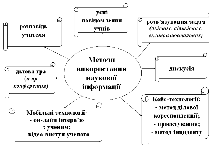
Рис. 4. Методи використання наукової інформації на уроках з природничих дисциплін

Перспективи подальших наукових розвідок. Проведене дослідження не висчерпує всіх аспектів підготовки вчителів природничих дисциплін з питання розвитку інтересу учнів до наук. Передбачається його продовження у контексті STEM-освіти через навчання вчителів з конструювання та робототехніки у системі післядипломної педагогічної освіти.