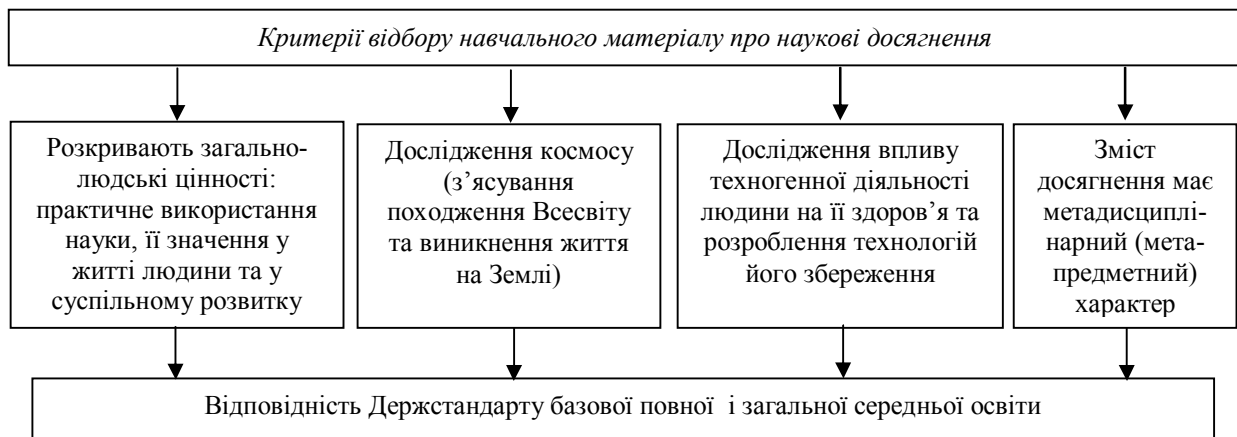
Рис. 3. Критерії відбору навчального матеріалу про наукові досягнення для уроків природничих дисциплін

1. Найфундаментальнішим питанням сучасного природознавства вважається: з'ясування походження Всесвіту та виникнення життя на Землі. Намагаючись дати найпростіше і найприродніше пояснення хімічного складу і структури Всесвіту, стандартної моделі, яка ґрунтується на загальній теорії Ейнштейна, не можна обійтися без двох сутностей, незвичайних для навколосемної фізики: темна матерія і темна енергія.