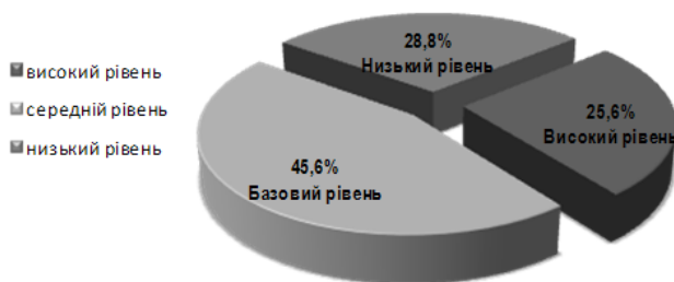
Рис. 2. Рівень сформованості загальнокультурної компетентності

Отже, на високому рівні загальнокультурна компетентність сформована у 25,6 % студентів, на середньому (базовому) рівні сформована у 45,6 % студентів, низький рівень мають 28,8 % студентів (рис. 2).