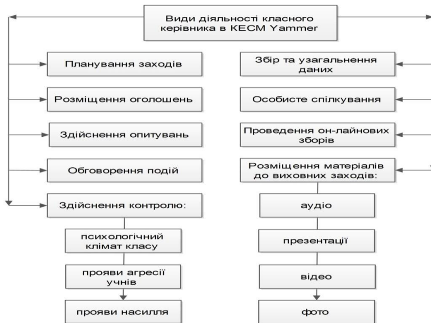
Рис. 1. Види діяльності класного керівника в КЕСМ

Як переконує досвід, внаслідок систематичної комунікації в КЕСМ Yammer, формується мовна культура учнів.