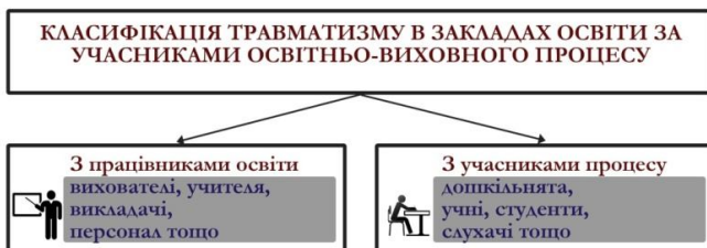
Рис. 3. Класифікація травматизму в закладах освіти за учасниками освітньо-виховного процесу

Травматизм у закладах освіти умовно можна класифікувати за учасниками процесу (рис.3). У свою чергу травматизм, що стався з дітьми, доцільно розділити за місцем виникнення події (рис.4).