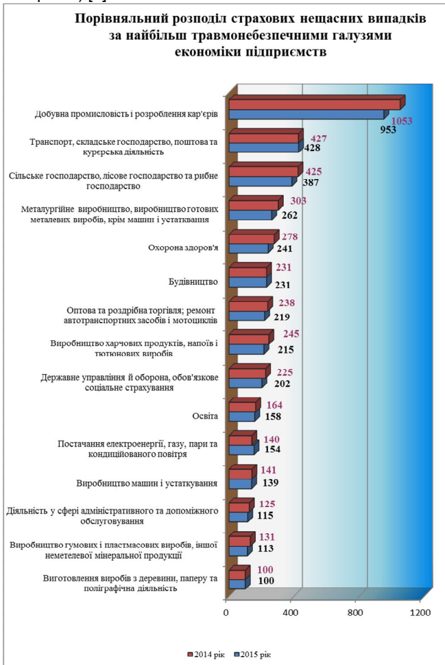
Рис.1. Порівняльний розподіл страхових нещасних випадків за найбільш травмонебезпечними галузями економіки підприємств [4]

На рис. 1 наведено порівняльний розподіл страхових нещасних випадків за найбільш травмонебезпечними галузями економіки підприємств за перші 9 місяців 2015 та 2014 років (Фонд соціального страхування від нещасних випадків на виробництві та професійних захворювань України) [4].