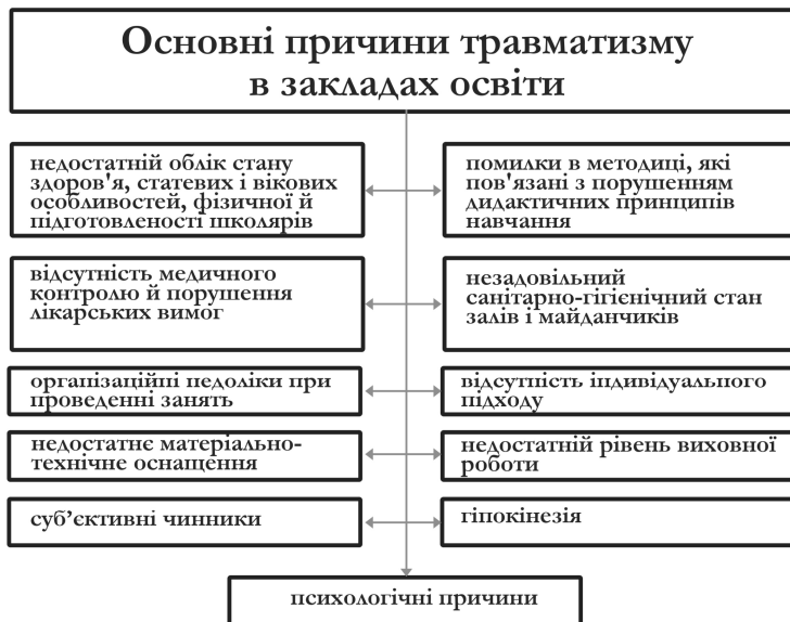
Рис.5. Причини травматизму в закладах освіти

При будь-яких видах дитячого травматизму дорослим, учителям, вихователям необхідно дотримуватися двох основних вимог: необхідно чітко налагодити організацію навчально-виховного процесу і впроваджувати різні інформаційні форми санітарно-освітньої роботи.