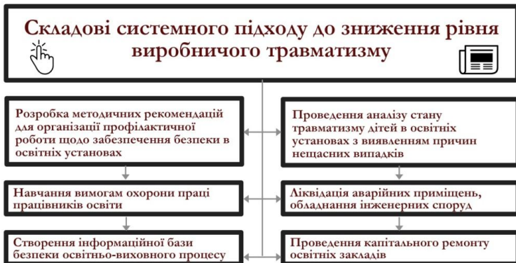
Рис.2. Системний підхід до зниження рівня травматизму в закладах освіти

Травматизм у закладах освіти умовно можна класифікувати за учасниками процесу (рис.3). У свою чергу травматизм, що стався з дітьми, доцільно розділити за місцем виникнення події (рис.4).