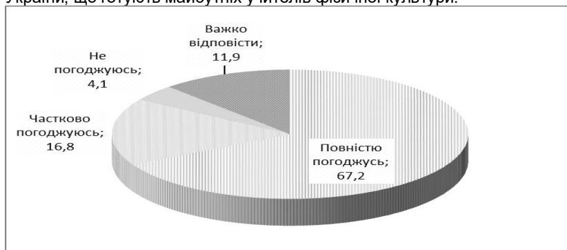
Рис. 1. Результати опитування (%) викладачів (n=84) про те, чи погоджуються вони з необхідністю впроваджувати інноваційні педагогічні технології в освітній процес закладів вищої освіти фізкультурного профілю

Важливість та актуальність упровадження в освітній процес сучасних технологій навчання підтверджують дані проведеного нами анкетного опитування викладачів провідних закладів вищої освіти України, що готують майбутніх учителів фізичної культури.