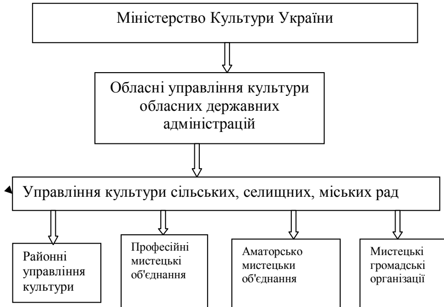
Рисунок 2 – Напрями реалізації державної політики професійного та аматорського мистецтва