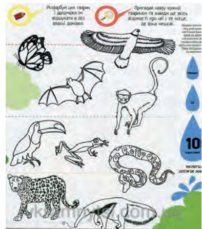
Рис 2. Приклади інфограм з книжки «Інфографіка для дітей»