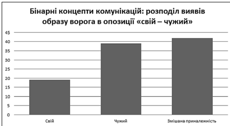
Діаграма 3. Бінарні концепти комунікацій: розподіл виявів образу ворога в опозиції «свій – чужий»

Інтолерантні лексеми концепту політичний опонент реферують із варіаціями до особи регіонала або колишнього представника відповідної партії ( сферичний регіонал – рєшалю, пейзан і вчорашній плебс; пташенята гнізда януковича, г*ндони і казнокради [8]; джокер у вигляді Кернеса [7]). Близькими за контекстом є вияви влади, що репрезентують недовіру суспільства ( відверто упороті ворюги [19], ВРУ як « бордель », депутати як « дівчатка » та « хлопчики » [12]).