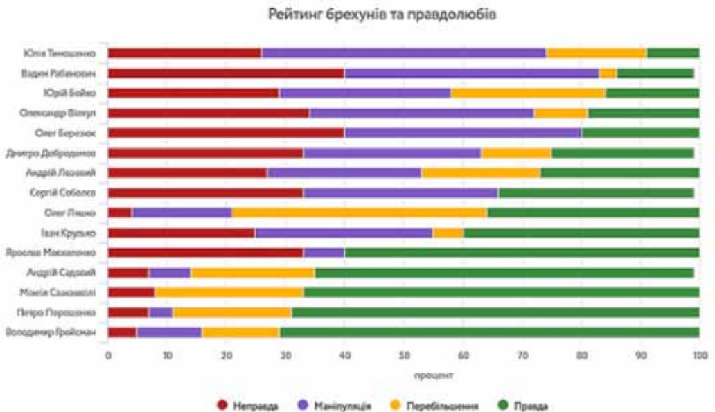
Рис. 4. Рейтинг правдивості висловлювань українських політиків за вересень-жовтень 2017 р. за дослідженням voxukraine.org.

VoxUkraine засновано після Революції гідності у 2014 р. групою висококваліфікованих економістів та юристів, які працюють в Україні і за кордоном. Зі слів професора Пітсбурзького університету співзасновника VoxUkraine Тимофія Милованова [18]: «У 2014 році економісти світового рівня хотіли допомогти Україні. Однак швидко з’ясувалося, що експертиза навіть нобелівських лауреатів нікому не потрібна – ні Кабміну, ні Верховній Раді. Тоді ми вирішили піти значно довшим, але більш фундаментальним шляхом: підвищувати рівень освіти та економічної дискусії в Україні. Саме так у вересні 2014-го з’явився блог для економістів – VoxUkraine.org». На цьому сайті розглядаються події, які відбуваються в Україні, незалежні експерти аналізують економічні та політичні процеси, виставляється економічний індикатор темпу економічних реформ, наводиться рейтинг ефективності міністерств, діяльності Верховної Ради і депутатів за допомогою математичних методів і BigData. Особливостями проекту є відкритість (будь-хто може написати економічну статтю) та добросовісність (два незалежних редактори перевіряють якість матеріалу та точність фактів). Відповідно до опублікованого рейтингу, Ю. Тимошенко, В. Рабинович та Ю. Бойко не турбуються про виконання обіцяного (рис. 4), мають найнижчий рейтинг правдивості. А Президент України П. Порошенко та Голова Кабміну В. Гройсман більшість своїх обіцянок виконали ( https://voxukraine.org/longreads/lie-theory/index-ua.html ).