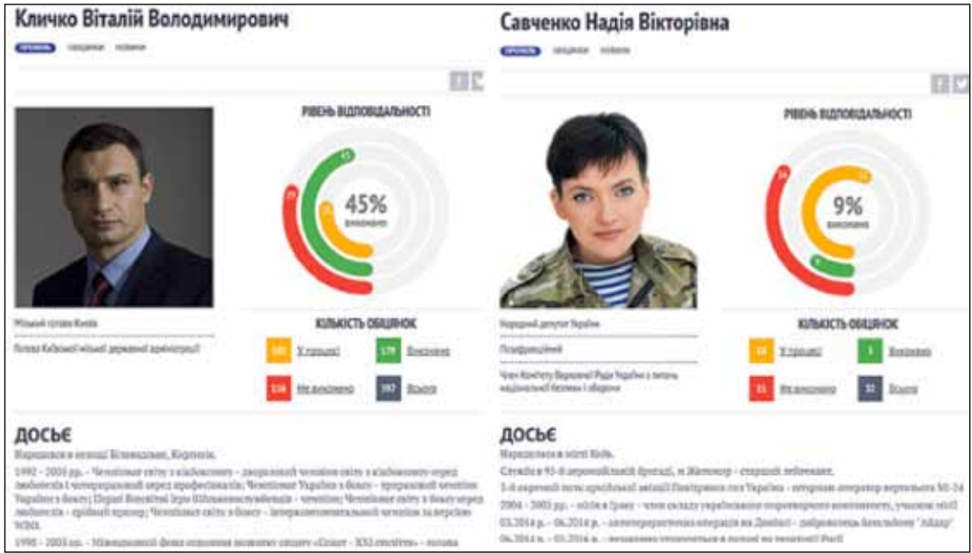
Рис.2. Контроль обіцянок українськими політиками (за дослідженням «Слово і Діло»)

ших днів роботи головною метою інформресурсу було знайти, перевірити й доказово продемонструвати перекручення інформації в ЗМІ, пропагандистських матеріалів про події в Україні. Згодом тематика розширилась, з'явилися дослідження методів впливу Росії на інші країни (Сирія, Грузія, Туреччина, Хорватія, США тощо). Важлива перевага сайту – багатомовність (10 мов), але відсутня українська. Це пов'язане з тим, що контент порталу спрямований на іноземну аудиторію. Матеріали сайту містять тексти, відео, подкасти, статті про події та тенденції інформаційної війни, яку веде Росія. Крім публікації фейкових матеріалів, автори сайту подають матеріали, які підвищують загальну медіаграмотність: розтлумачують як відрізнити фейк від