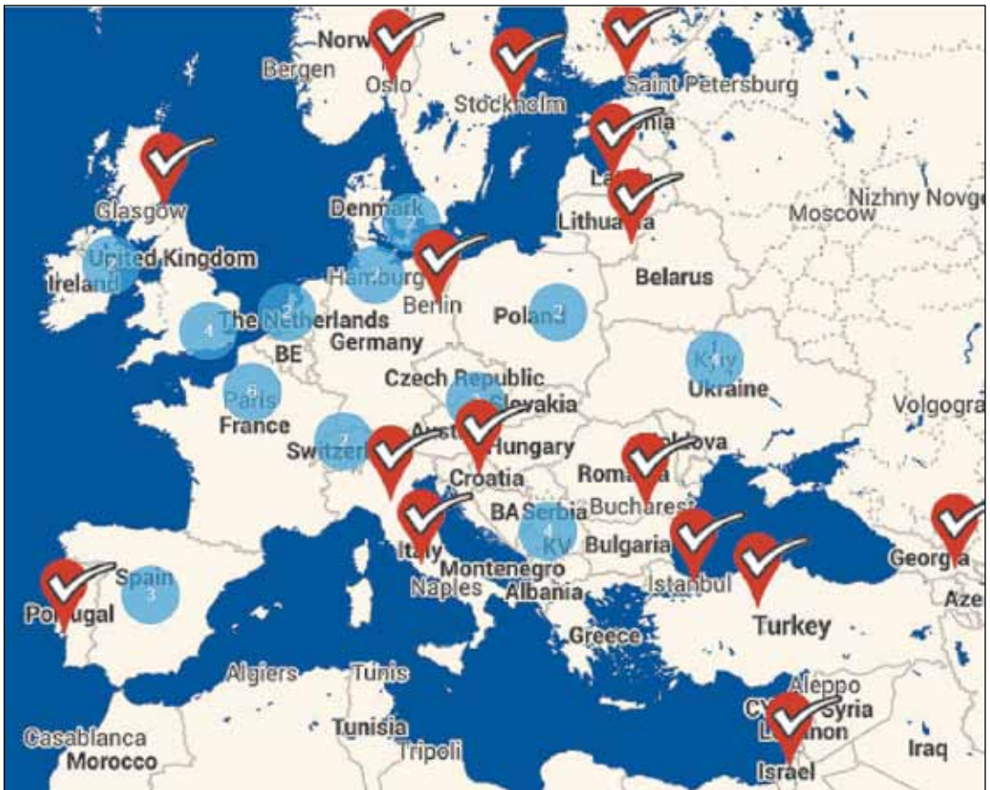
Рис.1. Локація фактчекінгових організацій на карті (за Duke Reporters' Lab).

Pants on fire – заява не точна і містить кумедні складники.